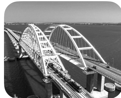
КРЫМСКИЙ МОСТ ЧЕРЕЗ КЕРЧЕНСКИЙ ПРОЛИВ